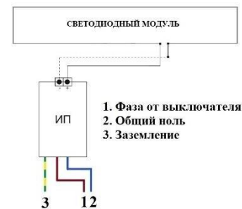
Схема подключения светильника

ВНИМАНИЕ! ПЕРЕД МОНТАЖОМ СВЕТИЛЬНИКОВ УБЕДИТЕСЬ В ТОМ, ЧТО СЕТЕВОЕ НАПРЯЖЕНИЕ ОТКЛЮЧЕНО! Подсоединить сетевые провода светильника к питающей сети. Фаза (Коричневый), Ноль (Синий), Заземление (желто-зеленый).