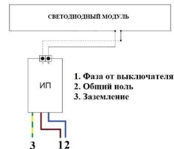
Схема подключения светильника

ВНИМАНИЕ! ПЕРЕД МОНТАЖОМ СВЕТИЛЬНИКОВ УБЕДИТЕСЬ В ТОМ, ЧТО СЕТЕВОЕ НАПРЯЖЕНИЕ ОТКЛЮЧЕНО! Подсоединить сетевые провода светильника к питающей сети. Фаза (Коричневый), Ноль (Синий), Заземление (желто-зеленый).