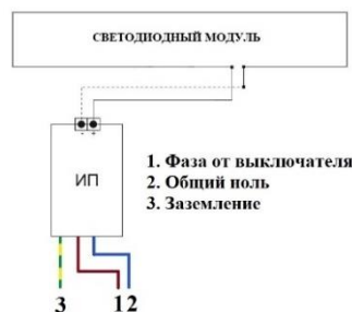
Схема подключения светильника

ВНИМАНИЕ! ПЕРЕД МОНТАЖОМ СВЕТИЛЬНИКОВ УБЕДИТЕСЬ В ТОМ, ЧТО СЕТЕВОЕ НАПРЯЖЕНИЕ ОТКЛЮЧЕНО! Подсоединить сетевые провода светильника к питающей сети. Фаза (Коричневый), Ноль (Синий), Заземление (желто-зеленый).