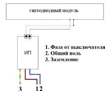
Схема подключения светильника

ВНИМАНИЕ! ПЕРЕД МОНТАЖОМ СВЕТИЛЬНИКОВ УБЕДИТЕСЬ В ТОМ, ЧТО СЕТЕВОЕ НАПРЯЖЕНИЕ ОТКЛЮЧЕНО! Подсоединить сетевые провода светильника к питающей сети. Фаза (Коричневый), Ноль (Синий), Заземление (желто-зеленый).