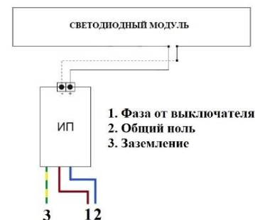
Схема подключения светильника

ВНИМАНИЕ! ПЕРЕД МОНТАЖОМ СВЕТИЛЬНИКОВ УБЕДИТЕСЬ В ТОМ, ЧТО СЕТЕВОЕ НАПРЯЖЕНИЕ ОТКЛЮЧЕНО! Подсоединить сетевые провода светильника к питающей сети. Фаза (Коричневый), Ноль (Синий), Заземление (желто-зеленый).